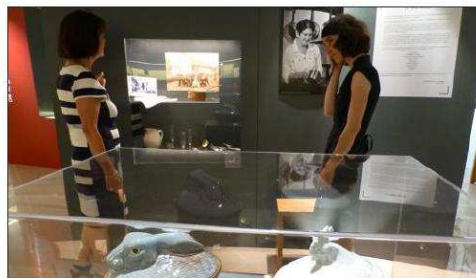
Une "chasse aux écrevisses" aura lieu au musée ce dimanche.