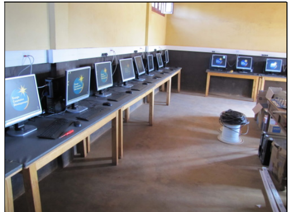
Un résultat professionnel...