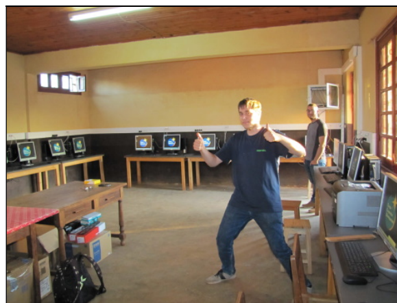
Une certaine fierté ...