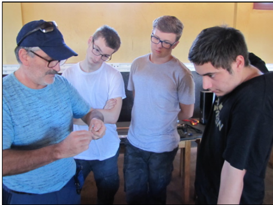
De l'écoute ...