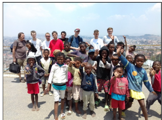
Une insertion dans la population...