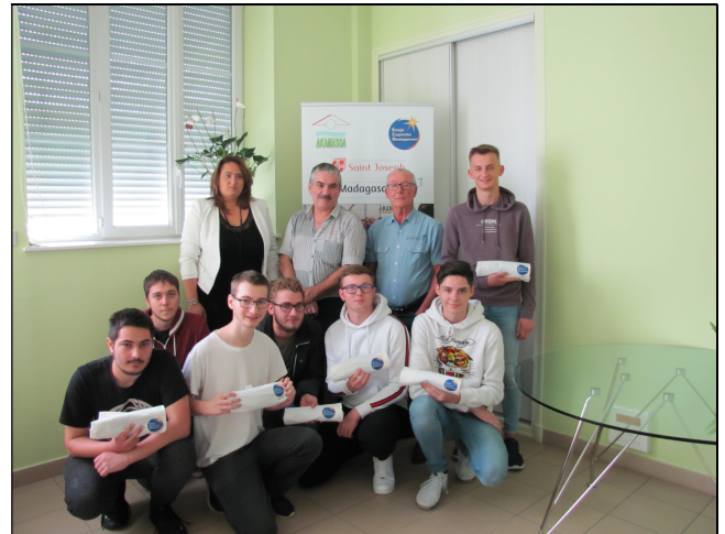
Remise officielle des Tshirt ECD...