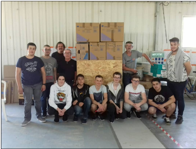
Préparation du conteneur...avec ECD