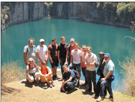
Un peu de tourisme ...