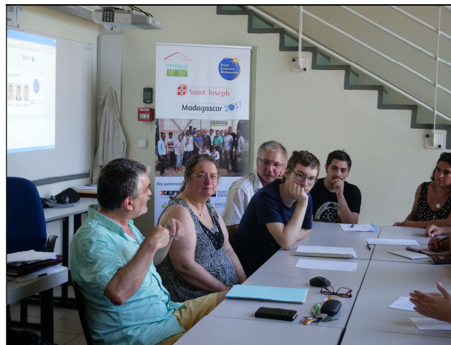
Réunion avec les parents ... La confiance est là !