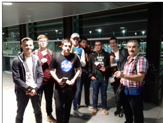
L'avion... déjà une aventure...