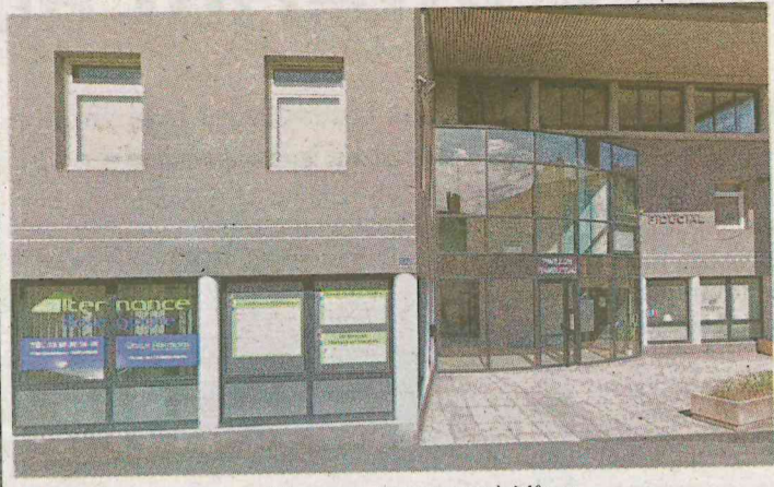
■ L'école de commerce Alternance Bourgogne à Mâcon.