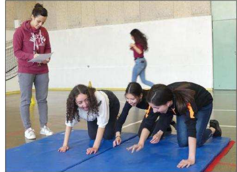
La santé commence par l'activité physique.

Aujourd'hui mercredi, la compagnie La Faute à Voltaire donnera une conférence « drolati-